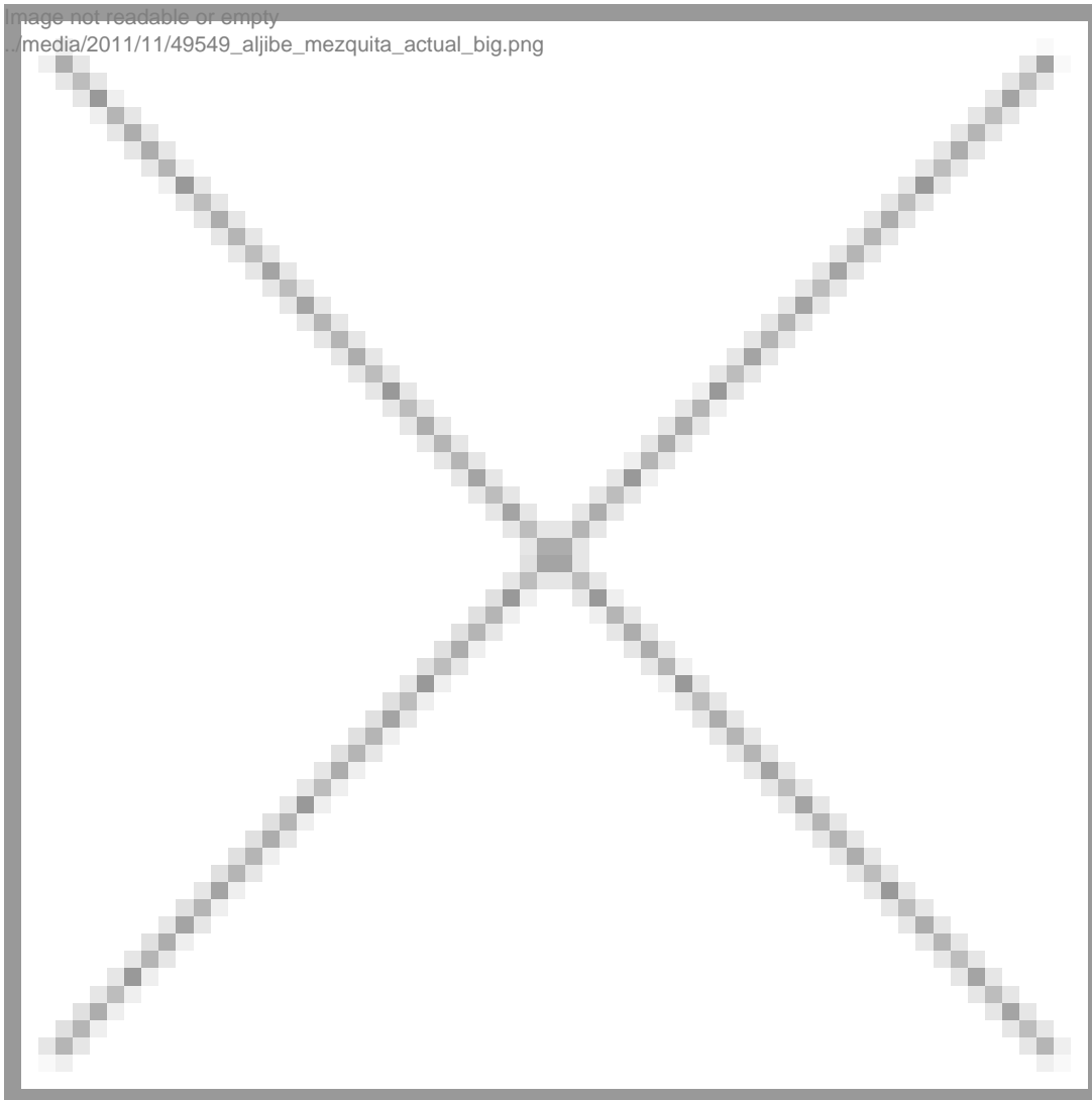
El aljibe de la mezquita aljama de Granada, en una fotografía reciente.