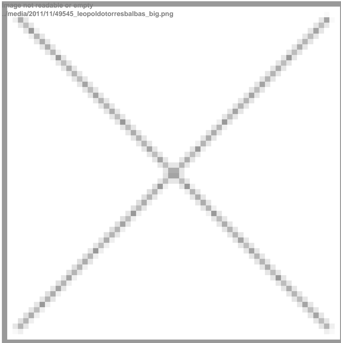
El arquitecto y arqueólogo Leopoldo Torres Balbás

Las naves estaban separadas por 130 arcos que descansaban sobre capiteles reutilizados (distintos de fuste) y carentes de basa, aunque no se descarta que la primera obra tuviese pies derechos en lugar de columnas y que, con el tiempo, fueron sustituidos. En 1704 aun subsistían 6 soportes de madera.