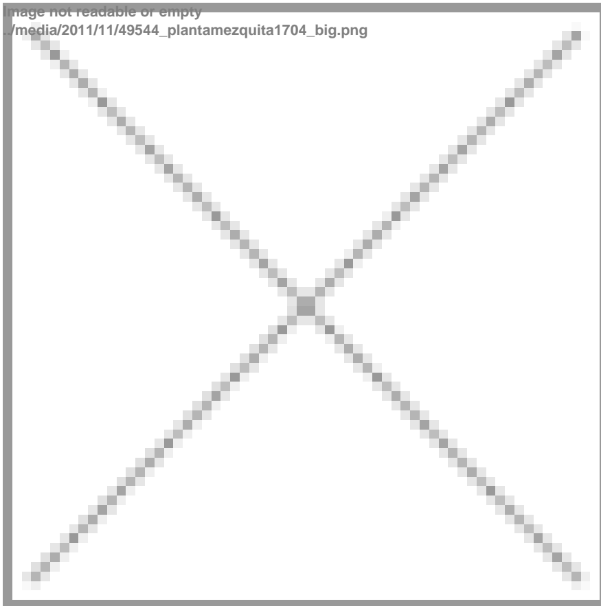
Planta de la mezquita aljama de Granada, según el plano dibujado por José Sánchez y Sebastián Díaz de 1704.

????De la mezquita aljama que Zawi mandó erigir, se conocen las características de su construcción por un plano fechado en 1704.