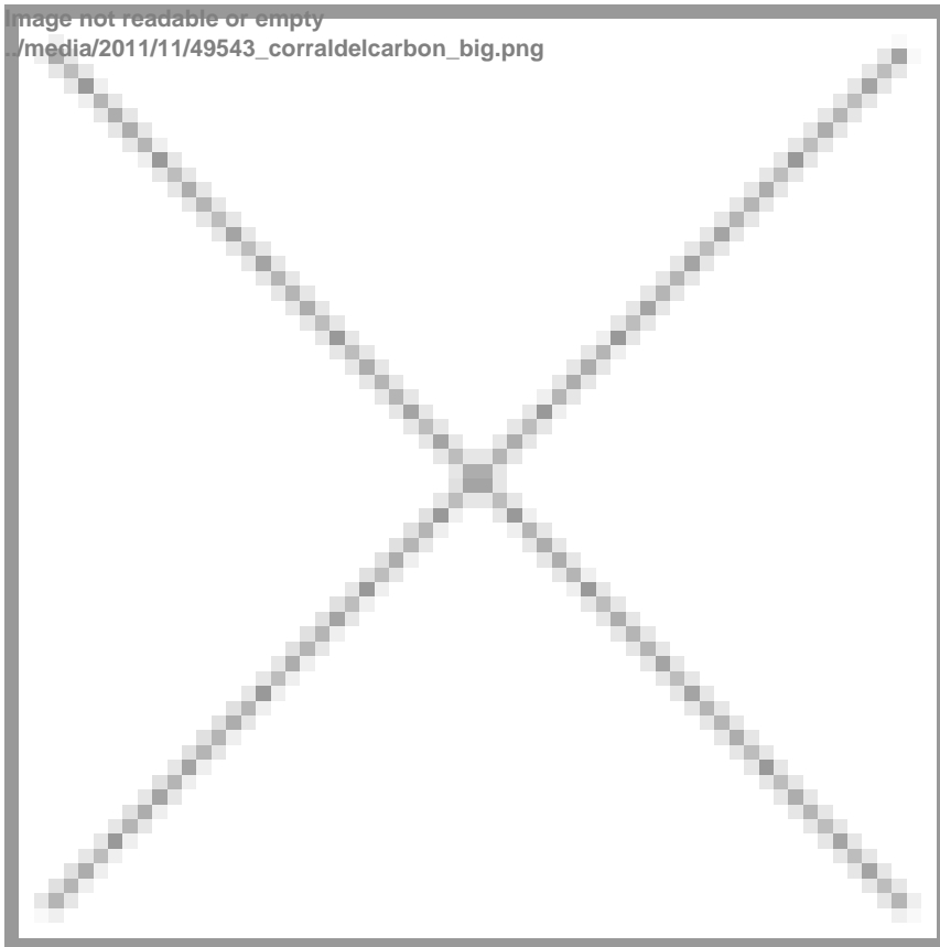
Fotografía de 1870 de la fachada de la Alhóndiga Yidida, hoy conocida como el Corral de Carbón.

Se iniciarían las obras de la mezquita aljama entre 1016 y 1038 con Zawi, el primer emir de Granada, fundador de la dinastía zirí, perteneciente a la dinastía sinhaya (o lamtuna), es decir, “ portadores de velo ”. Los sinhayas eran seguidores de los fatimíes en oposición de la tribu zanata, que era antifimita.